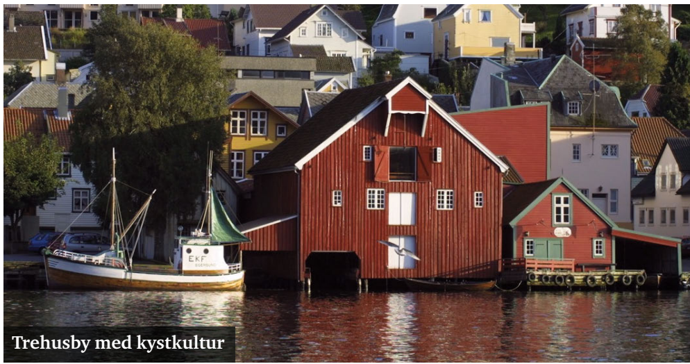
Trehusby med kystkultur