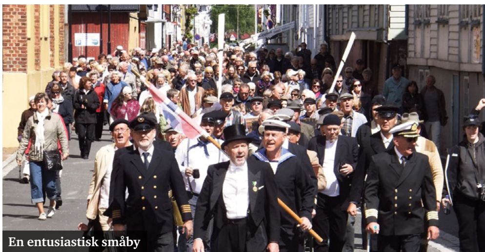
En entusiastisk småby